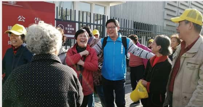
11月5/7/14日 力国半天孙 出游活动