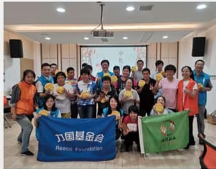
2019年9月9日 在七宝镇阳光之家开展了 制作冰皮月饼和手工衍纸 的活动。