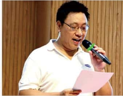
2019年8月24日 “飞叶·星梦杯” 第四届全国心智障碍者 软式排球交流赛