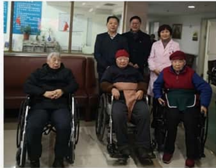
2019年9月29日 闵行区纪念第32个重阳节 “美的温度 爱永远在路上”